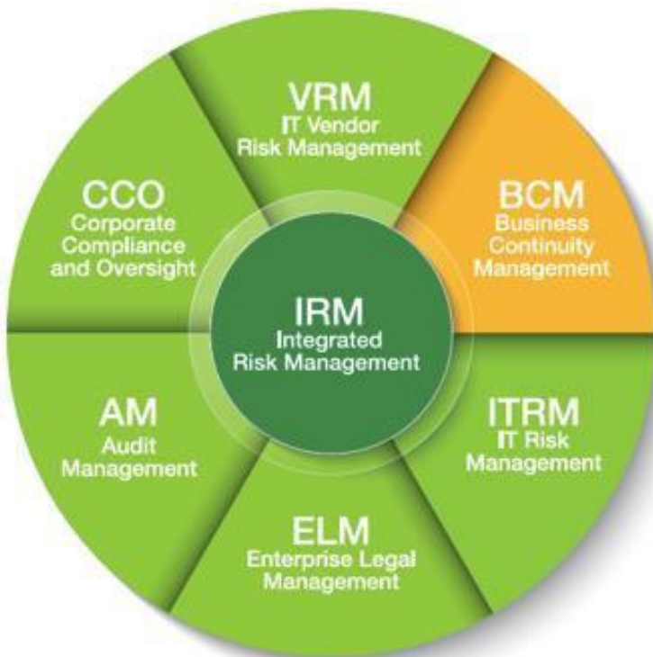
Abbildung 3: Wichtige Bereiche des Integrated Risk Management

Weitere Informationen finden Sie unter www.servicenow.de .